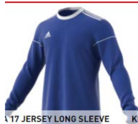
Squadra 17 JERSEY LONG SLEEVE K